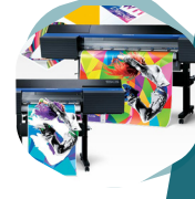
Soluciones gráficas digitales