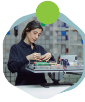
Montajes electromecánicos y manipulados