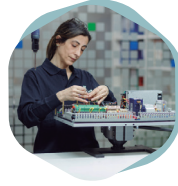
Montajes electromecánicos y manipulados