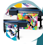
Soluciones gráficas digitales