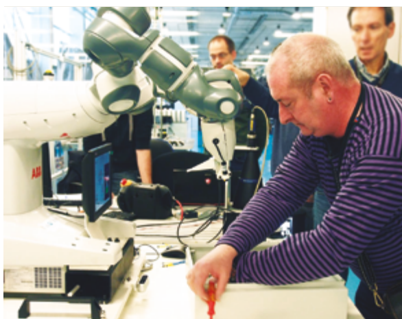
• Prueba con expertos y personas de Lantegi Batuak con el demostrador de robot en el centro tecnológico de IK4 TEKNIKER.