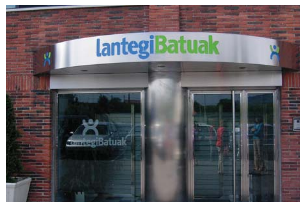
Entrada de las oficinas centrales con la nueva imagen

El cambio de imagen corporativa de Lantegi Batuak ha llegado ya a los rótulos y carteles de los centros; Loiu, Rekalde, Erandio...ya han adaptado su señalética a la nueva marca, y muchos lo harán próximamente. Durante el cambio en el taller de Rekalde, apareció un antiguo rótulo (imagen de la izquierda), con el logotipo más antiguo de Lantegi Batuak, de la década de los 80.