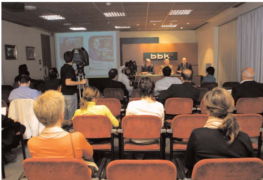
Rueda de prensa en la que se presentó la campaña