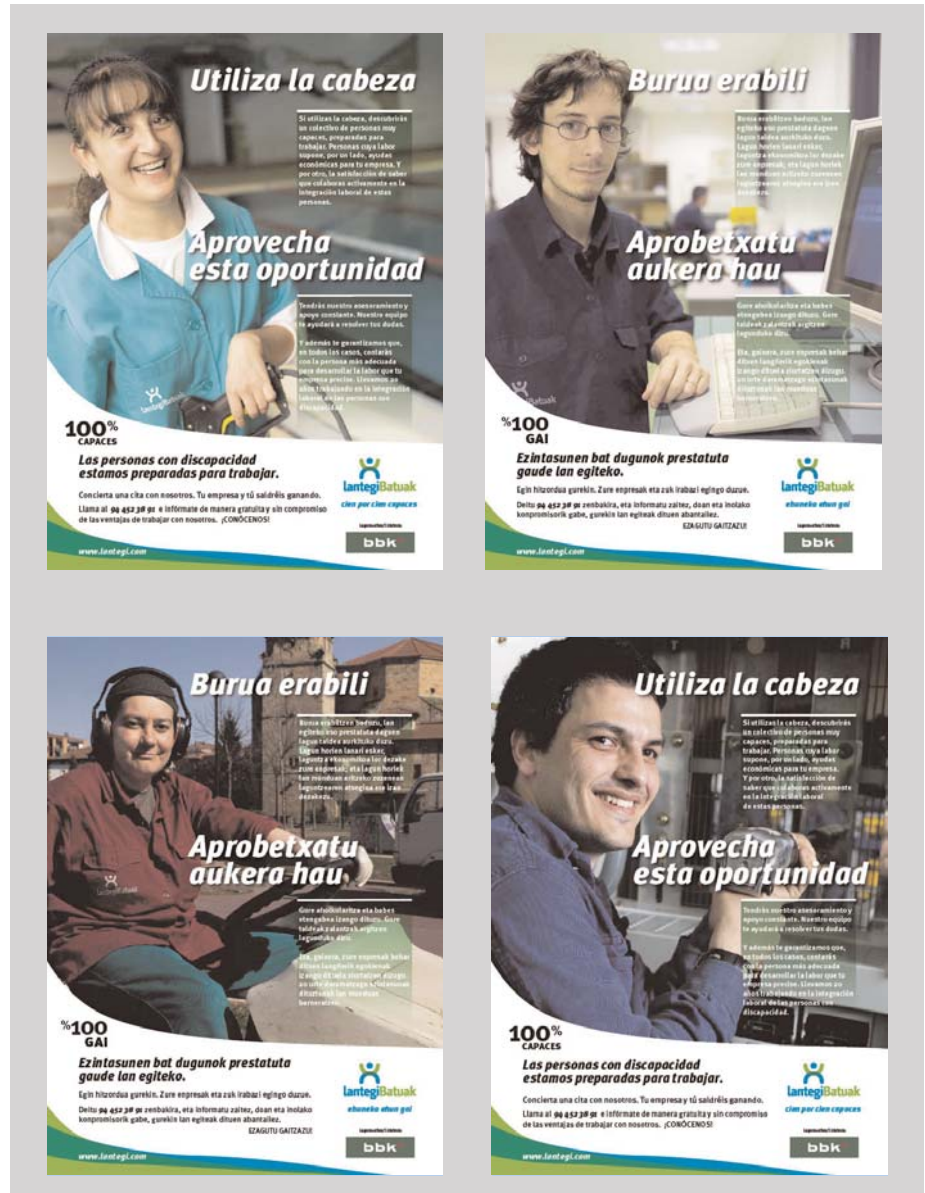
éstos son los anuncios que han aparecido en la prensa

Euren irudia iragarki eta triptikoetarako utzi duten Lantegi Batuak fundazioko langileak aintzat hartu behar dira. Enpresa arruntetan lan egiteko gaitasuna duten pertsonak ordezkatzan dituzte, eta, euren esker, proiektuak aurrera egin du.